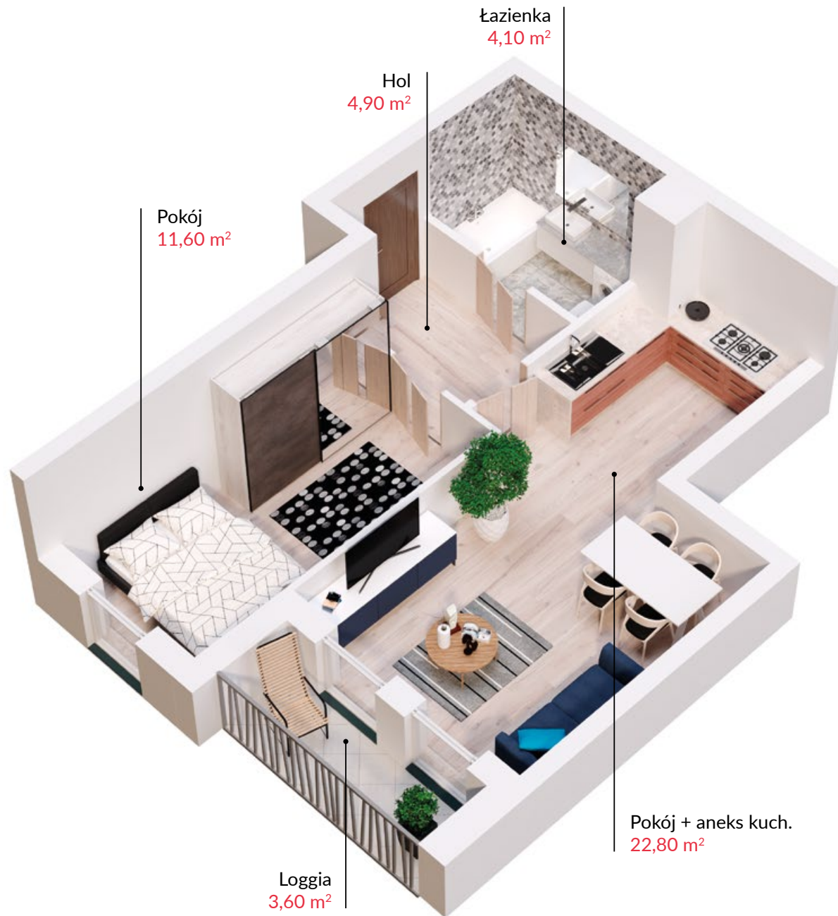
Rzut lokalu zakłada przykładowe umeblowanie pomieszczeń

SPRZEDAŻ MIESZKAŃ: kom. 601 88 66 88 | sprzedaz@t1.pl