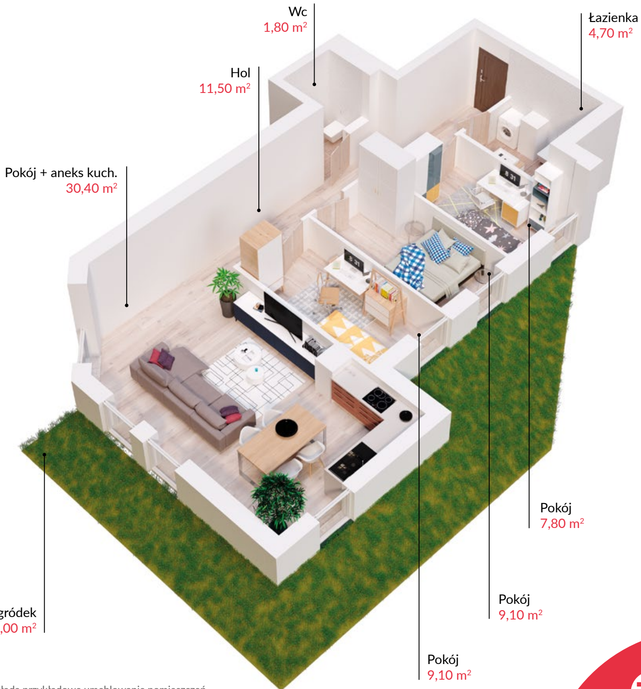
Rzut lokalu zakłada przykładowe umeblowanie pomieszczeń

SPRZEDAŻ MIESZKAŃ: kom. 601 88 66 88 | sprzedaz@t1.pl