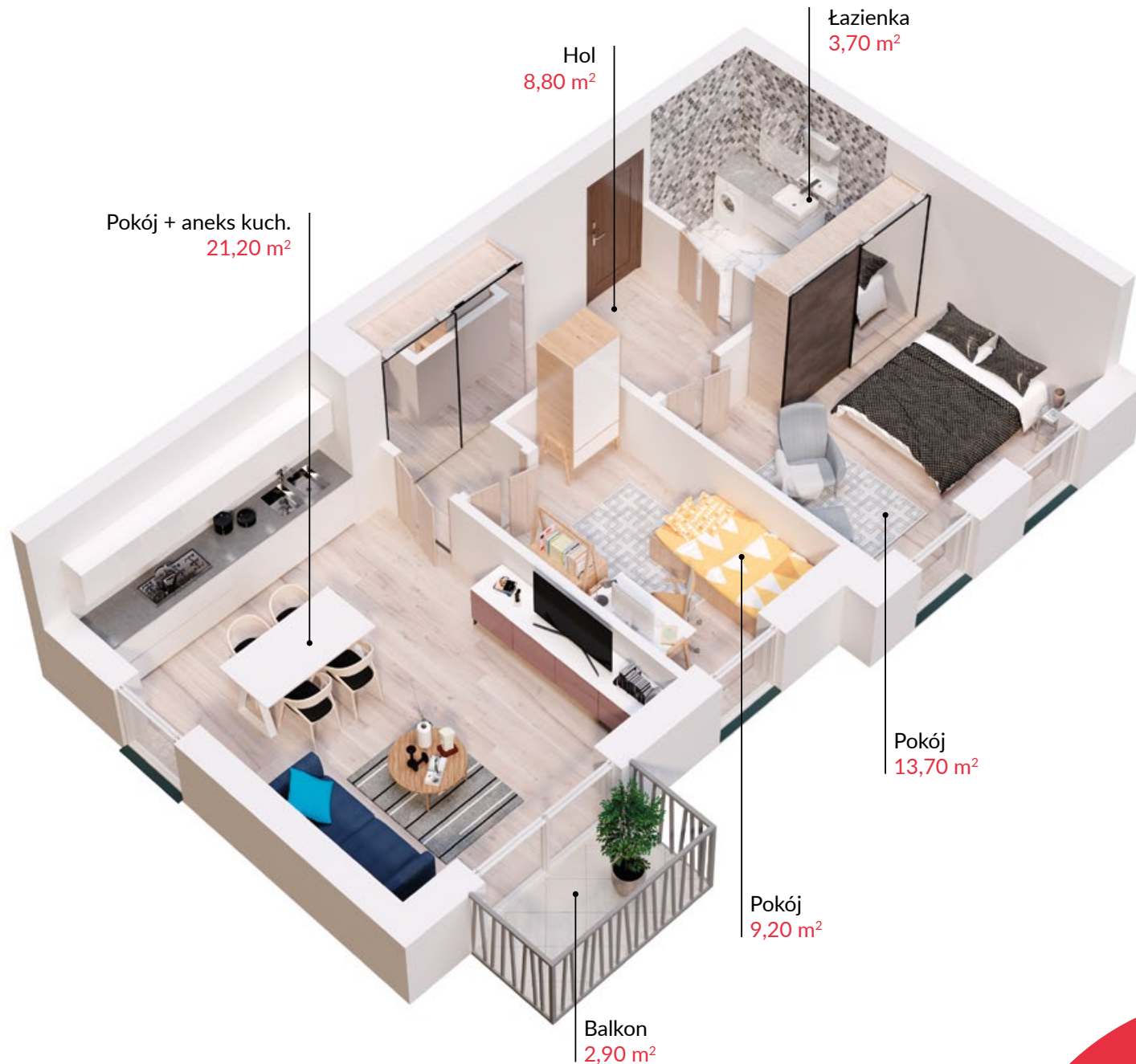
Rzut lokalu zaktada przykładowe umeblowanie pomieszczeń

SPRZEDAŻ MIESZKAŃ: kom. 601 88 66 88 | sprzedaz@t1.pl