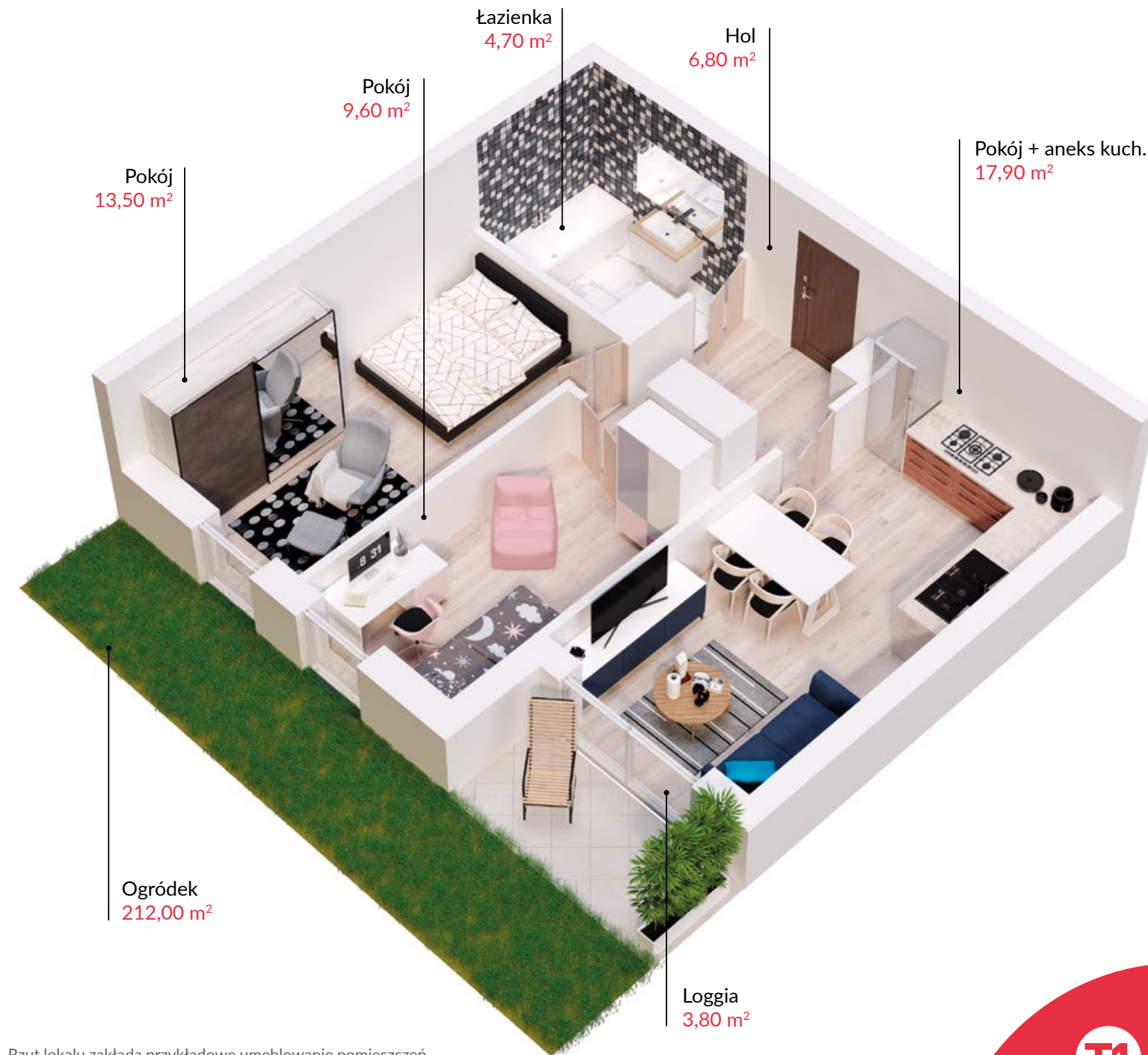
Rzut lokalu zaktada przykładowe umeblowanie pomieszczeń

SPRZEDAŻ MIESZKAŃ: kom. 601 88 66 88 | sprzedaz@t1.pl