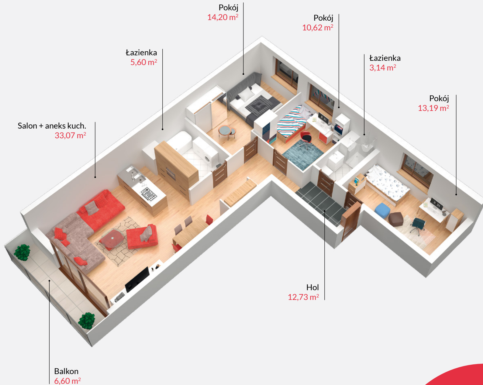
Rzut lokalu zakłada przykładowe umeblowanie pomieszczeń