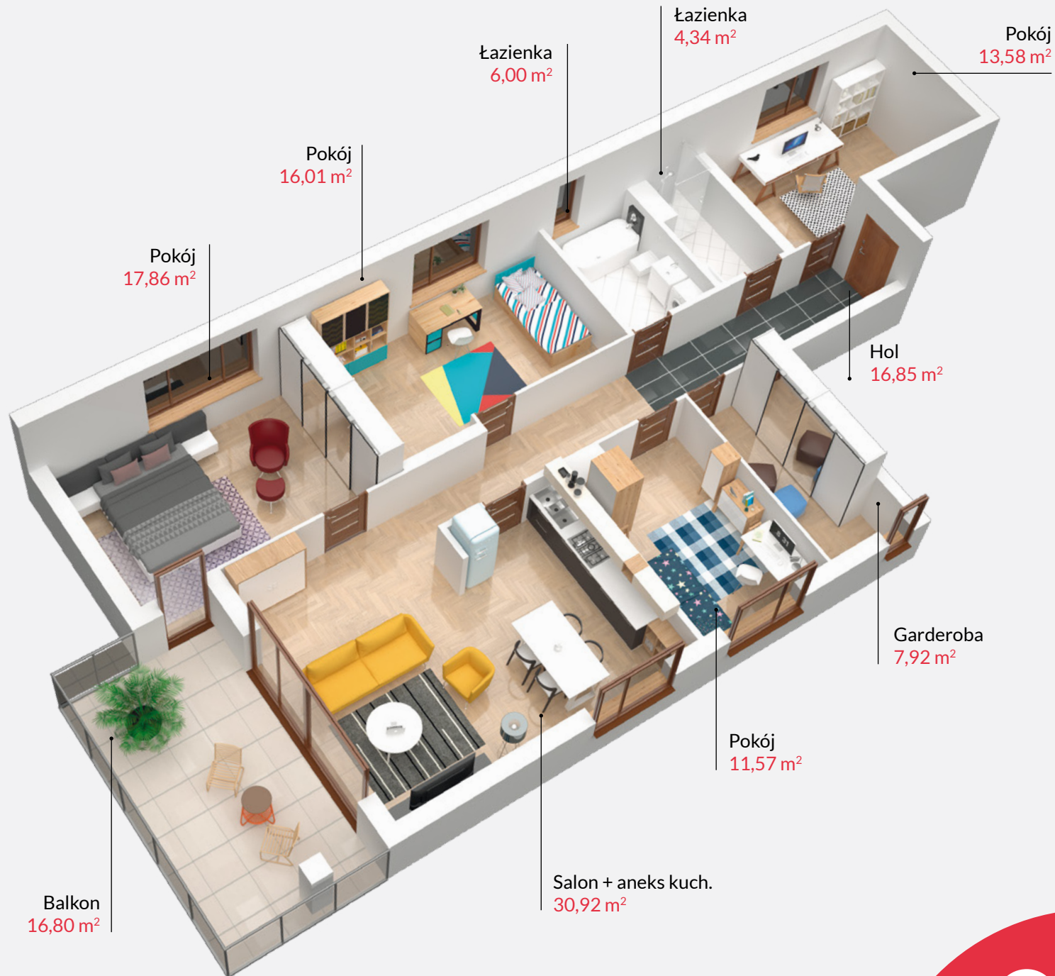
Rzut lokalu zaktada przykładowe umeblowanie pomieszczeń

SPRZEDAŻ MIESZKAŃ: kom.697 850 333 | saskalia@t1.pl