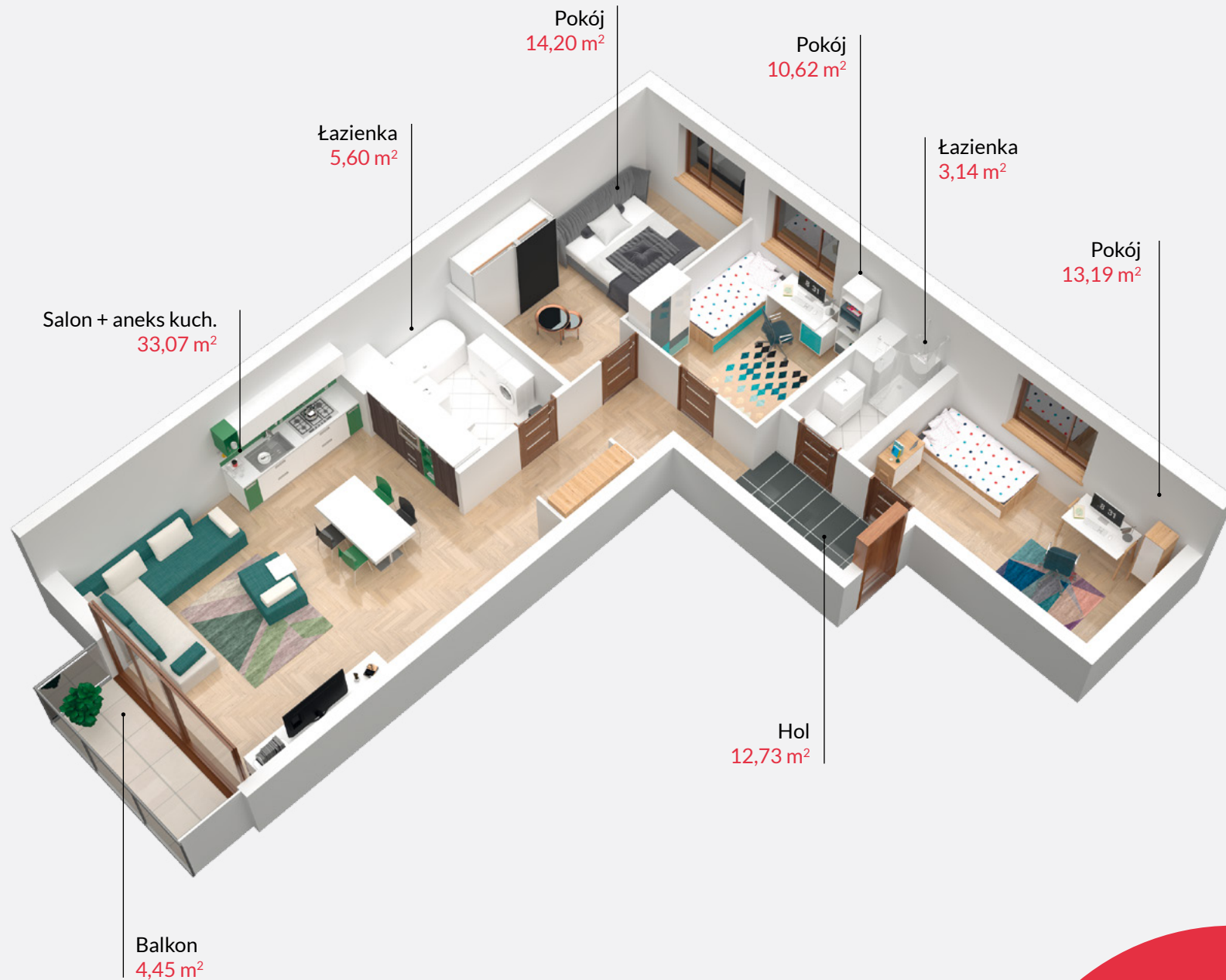
Rzut lokalu zakłada przykładowe umeblowanie pomieszczeń