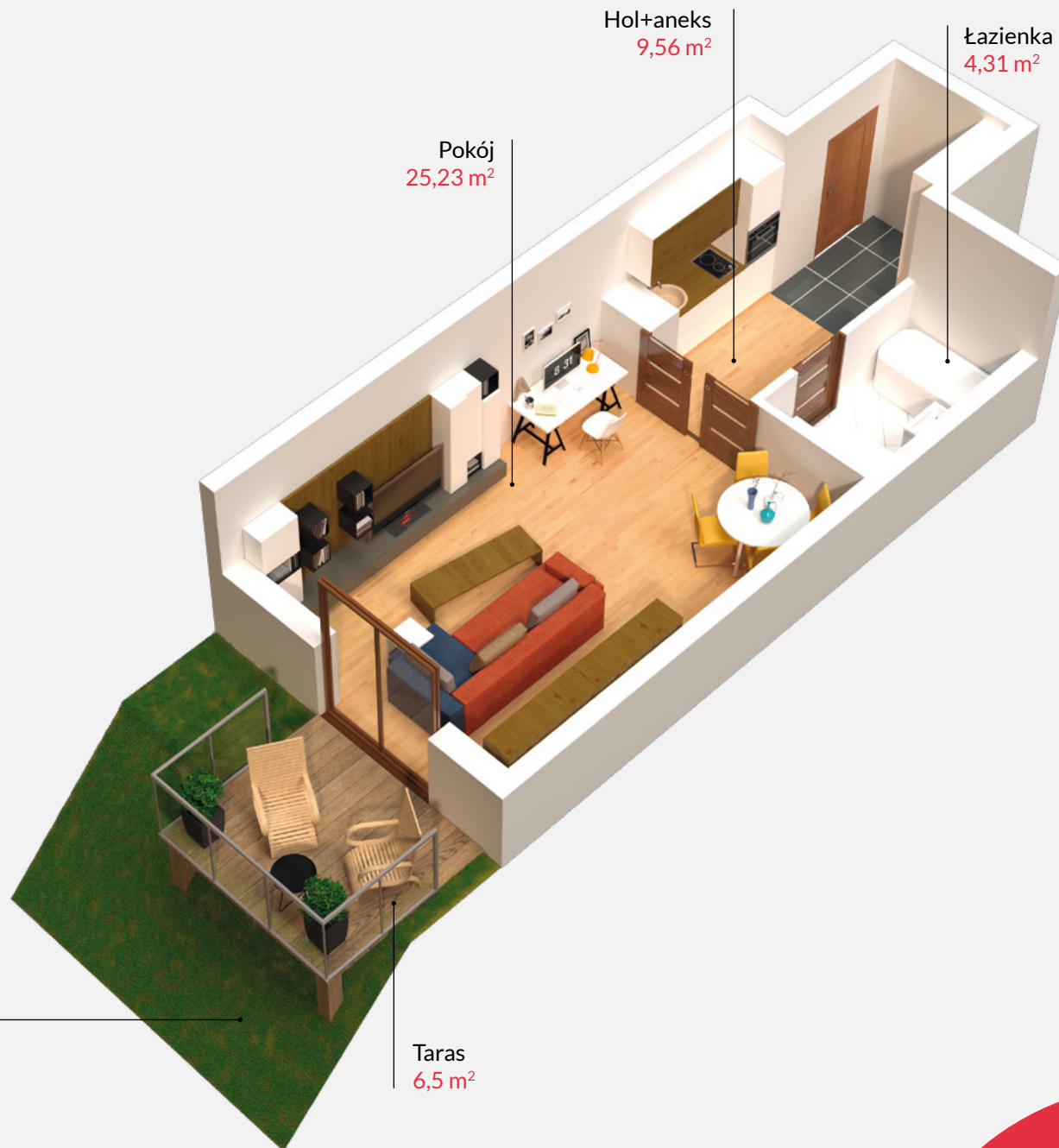
Rzut lokalu zakłada przykładowe umeblowanie pomieszczeń

SPRZEDAŻ MIESZKAŃ: kom.697 850 333 | saskalia@t1.pl