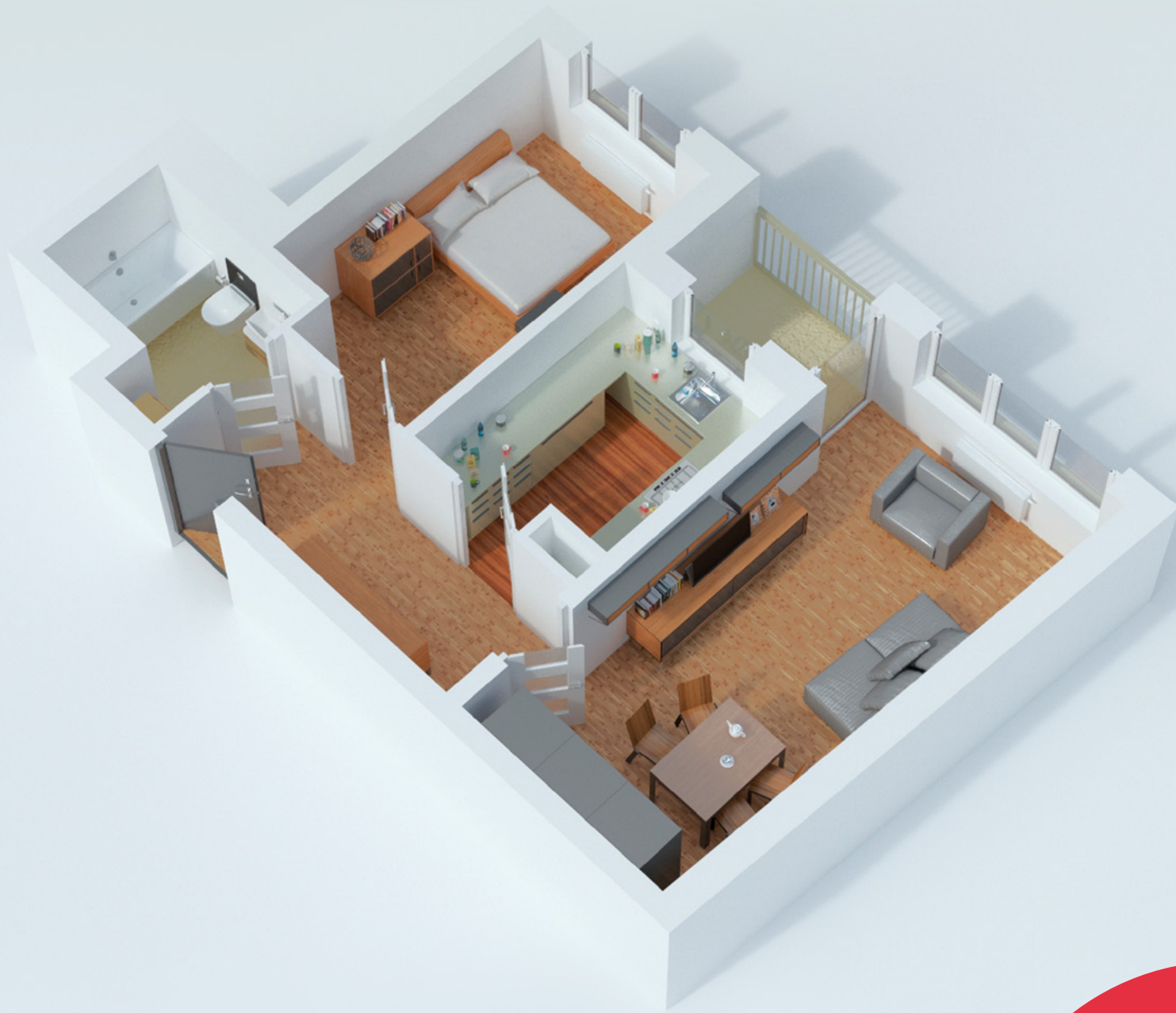
Rzut lokalu zakłada przykładowe umeblowanie pomieszczeń

SPRZEDAŻ MIESZKAŃ: ul. Ostrobramska 130 | kom. 601 88 66 88 | sprzedaz@t1.pl