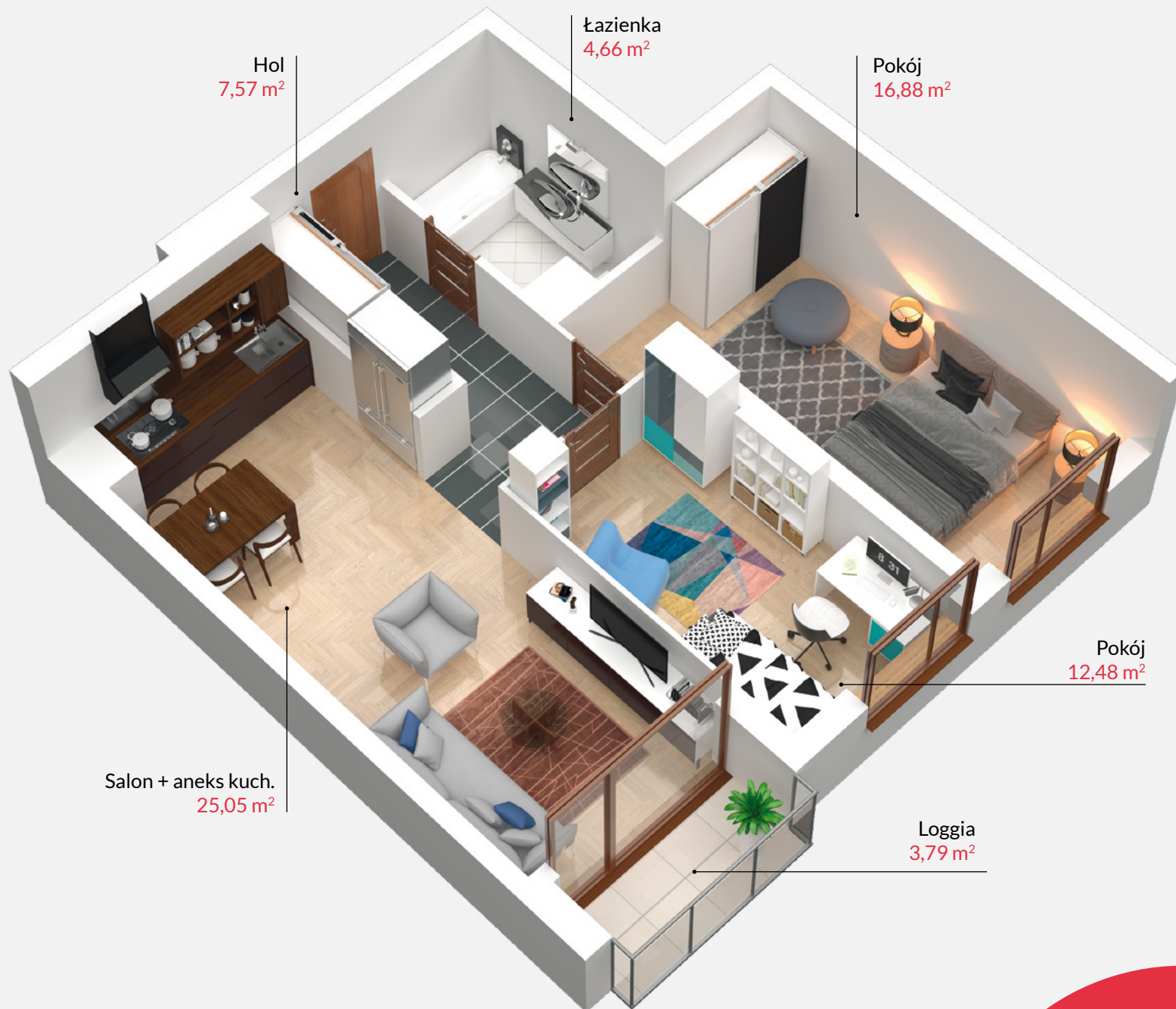
Rzut lokalu zakłada przykładowe umeblowanie pomieszczeń