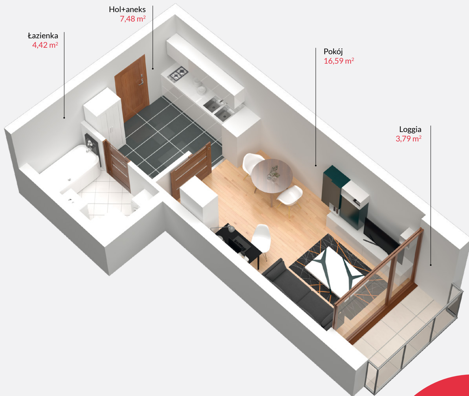
Rzut lokalu zakłada przykładowe umeblowanie pomieszczeń